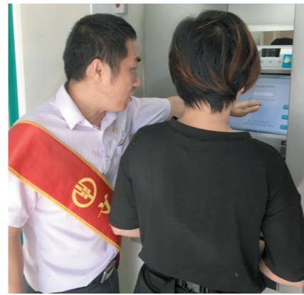
市民在银行工作人员的帮助下“刷脸”取钱。

据韩干才介绍,自从该行投入使用人脸识别系统近三个月以来,帮助了不少客户实现了无卡存取款业务。“现在每天有近40名客户使用人脸识别系统。”韩干才说。