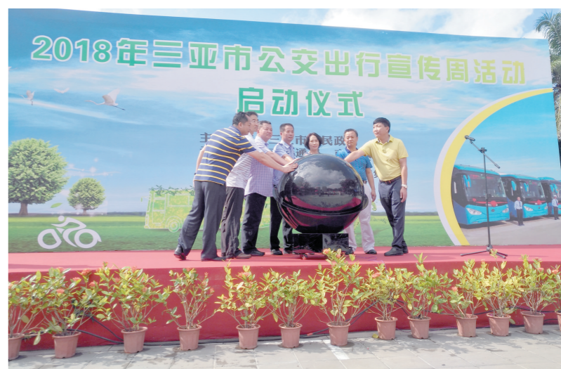
三亚公交出行宣传周正式启动

本报讯(记者 赵庆山)9月19日上午,以“绿色出行,从身边做起”为主题的三亚公交出行宣传周活动启动仪式在大东海广场举行。据悉,截至今年6月,三亚公交线路已达85条,营运车辆1102辆,为市民出行提供保障。