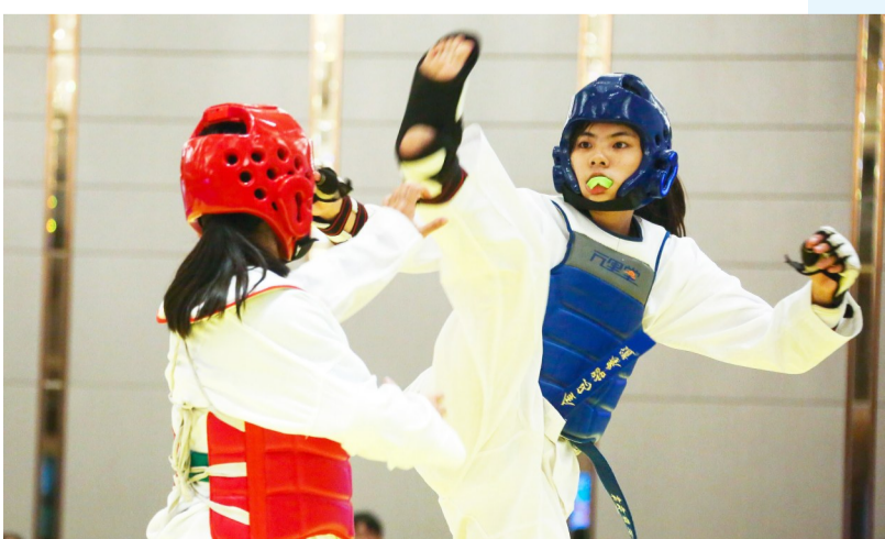
8月14日,省运会“国佳杯”跆拳道比赛进入第二天,当日,共产生产9块金牌。三亚代表队分别在女子乙组49kg、52kg、55kg和59+kg四个级别比赛中夺得金牌,以6枚金牌位居榜首。