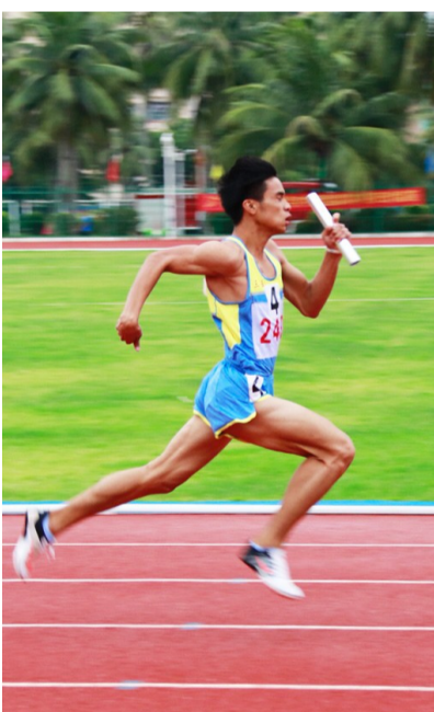
左图:8月14日下午,三亚队一名男运动员在男子丙组4×100米决赛中。