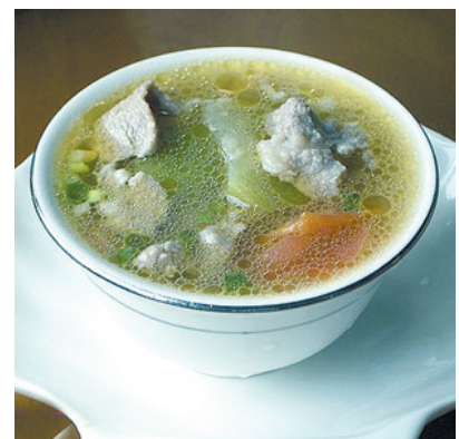
丝瓜木瓜滚瘦肉片汤