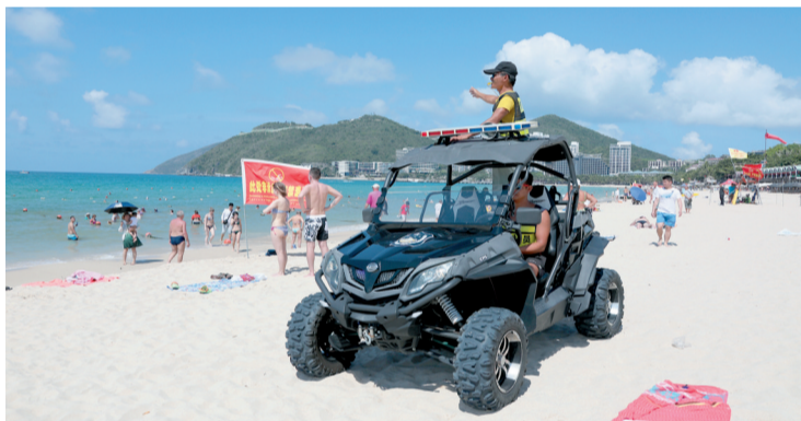
上图:值班救生员驾驶沙滩车在海边进行安全巡逻。