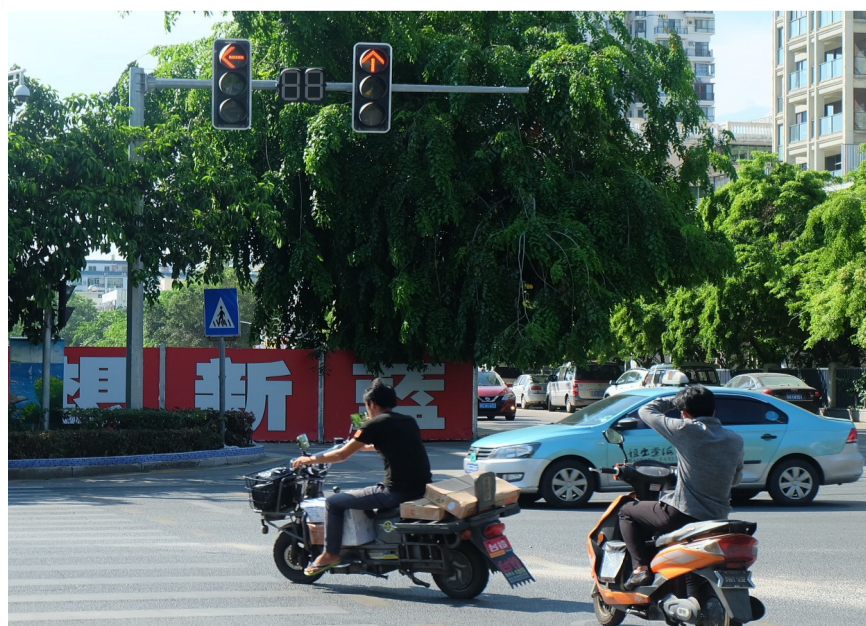
迎宾路与老铁路交叉口“抢秒”而过的电动车。

随后,三亚日报记者在其他重要交通路段,蹲点统计电动车闯红灯现象。据统计,10分钟内,金鸡岭街与解放路交叉口有16辆电动车闯红灯;解放路与友谊路交叉口有9辆电动车闯