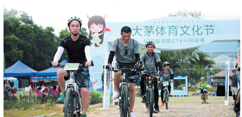
大茅体育文化节

奇幻之旅、骑行之旅、公益之旅……将传统与现代有机结合,体育与田园融合,文化与旅游连接,展现了“小乡村”玩转“大体育”的美丽乡村新风采。5月21日,持续三天的三亚市美丽乡村文化旅游文化节系列活动之大茅体育文化节在吉阳区远洋Lulu的农庄闭幕,“生态体育”给大茅村注入新动力。