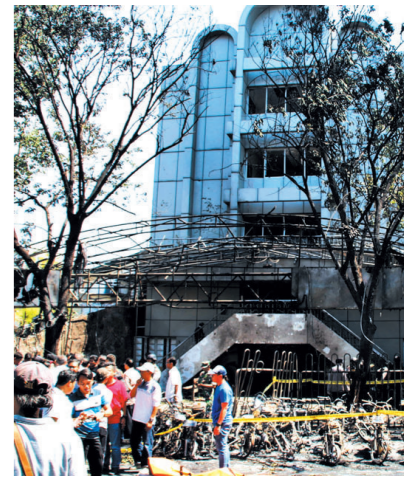
5月13日,在印度尼西亚东爪哇省泗水市,人们聚集在爆炸现场。

据新华社雅加达5月13日电 印度尼西亚警方13日确认,印尼东爪哇省首府泗水市当天早上发生的3起教堂袭击事件已致8人死亡、38人受伤。