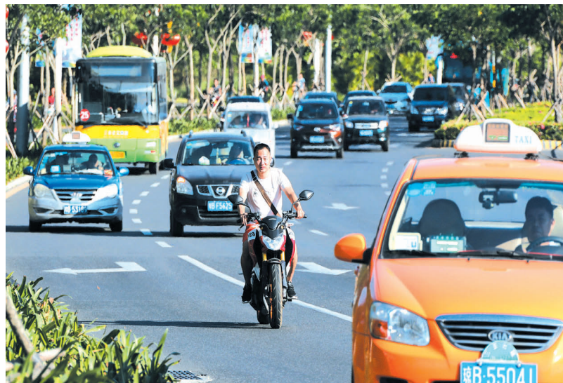
一辆电动车进入机动车道。

“80%的交通事故源于机非混行。”交警支队吉阳大队二中队25度岗组长毕力格告诉记者,非机动车属于弱方,若在机动车道上发生碰撞,伤的是非机动车;同时非机动车因自身灵活,在机动车道上飞速穿梭,容易使机动车急刹车,从