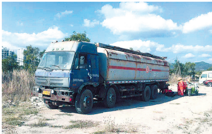
天涯区取缔非法流动加油站的一辆大型罐式加油车。

者,该临时停车场是海南省旅游客运服务中心用于停放旅游大巴车辆的场所,油罐车向大型罐式储油箱卸油后,通过简易加油设备机向停放在此的旅游大巴车加油。据执法人员现场查看相关收据资料,该非法加油站同时还涉嫌存在向他人倒卖销售成品油行为。