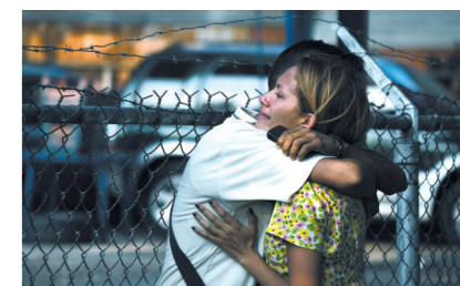
3月28日,在委内瑞拉卡拉沃沃州,家属在警局看守所外相互拥抱。委内瑞拉卡拉沃沃州一警局看守所28日起火,导致至少68人死亡。