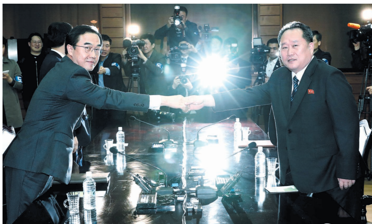
右图:3月29日,在板门店朝方一侧的统一阁,韩国统一部长官赵明均(左)和朝鲜祖国和平统一委员会委员长李善权在会谈后握手。

方代表团团长为朝鲜祖国和平统一委员会委员长李善权。 本月21日,韩国决定向朝鲜提议29日在板门店朝方一侧的统一阁举行韩朝高级别会谈,为计划于4月举行的韩朝首脑会晤做准备。 这将是第三次韩朝首脑会谈。2000年,时任韩国总统金大中访朝,与时任朝鲜最高领导人金正日发布“6·15”共同宣言,开辟了南北和解合作的新时期。2007年,时任韩国总统卢武铉访朝,与金正日签署并发表《南北关系发展与和平繁荣宣言》。