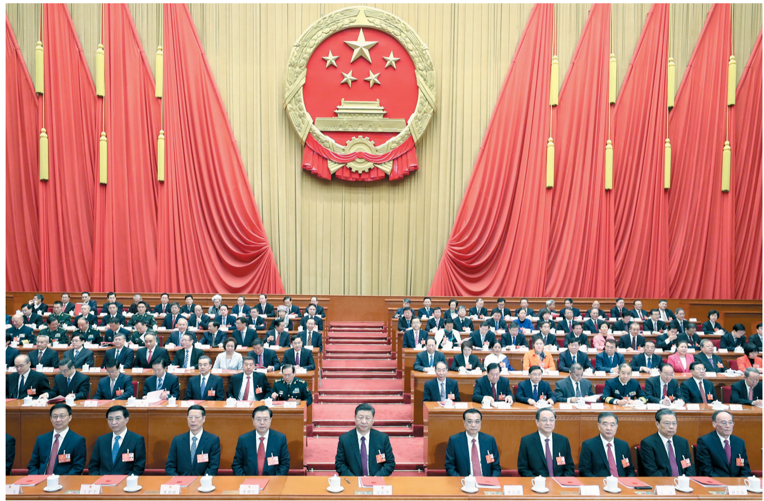
3月20日，第十三届全国人民代表大会第一次会议在北京人民大会堂闭幕。中共中央总书记、国家主席、中央军委主席习近平发表重要讲话。