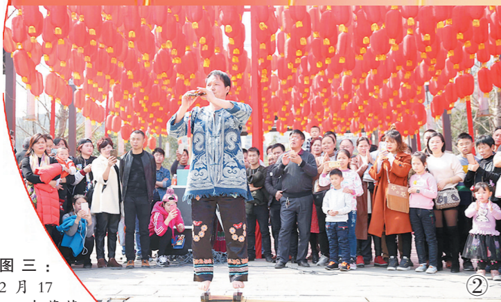
图三:2月17日,在葡萄牙阿威罗市中心广场,阿威罗大学孔子学院的学生表演中国功夫。