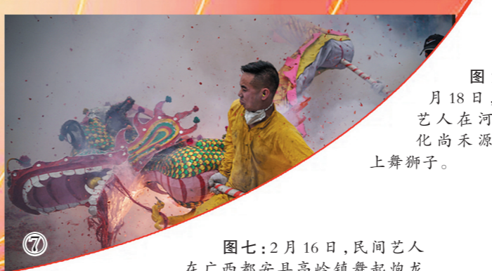
图七:2月16日,民间艺人在广西都安县高岭镇舞起龙拜大年。