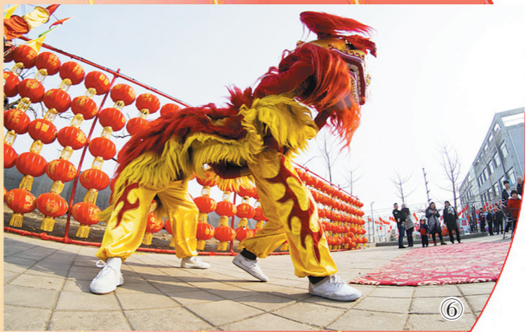
图六:2月18日,民间艺人在河北遵化尚禾源庙会上舞狮子。