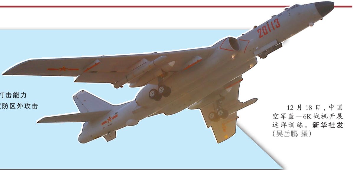
12月18日,中国空军轰-6K战机开展远洋训练。