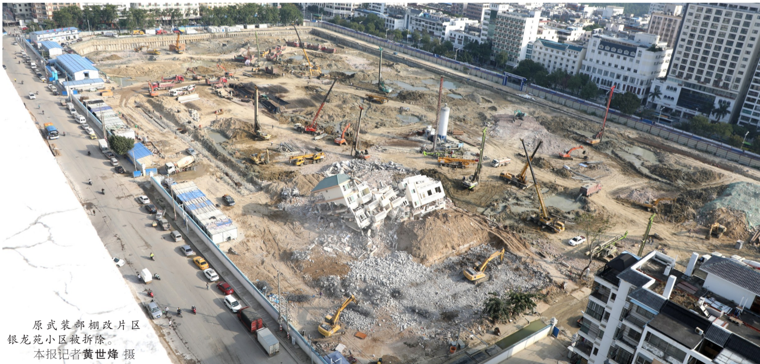
原武装部棚改片区银龙苑小区被拆除。

省委巡视组在三亚工作2个月,巡视期间为2017年11月14日至2018年1月14日