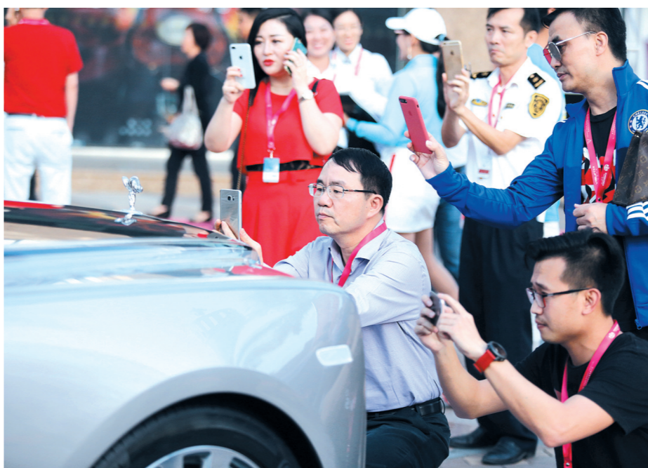
12月8日, 众多嘉宾用手机拍摄全新劳斯莱斯幻影。

“王的盛筵”当晚共成功拍卖出8件臻品, 募集善款高达人民币148万元。海天盛筵将晚宴筹集的所有善款都捐助给三亚爱心阳光脑瘫儿童康复中心, 用于福利院脑瘫儿童的后续康复治疗, 希望利用自身的影响力弘扬社会正能量, 并帮助更多的少年儿童可以在爱的氛围下健康成长, 拥抱梦想人生。