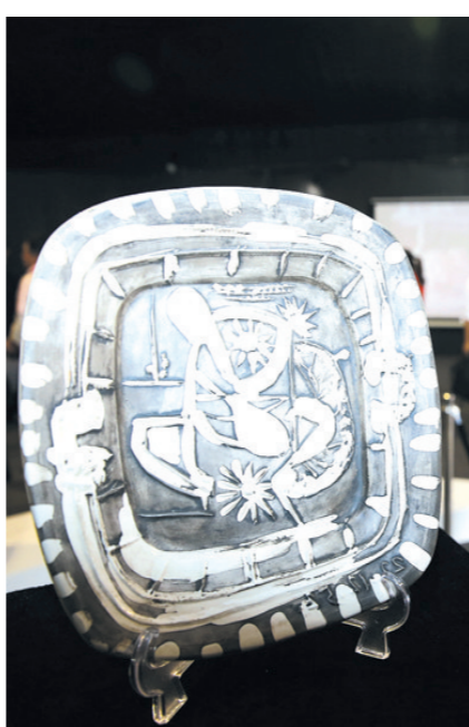
巴勃罗·毕加索艺术作品