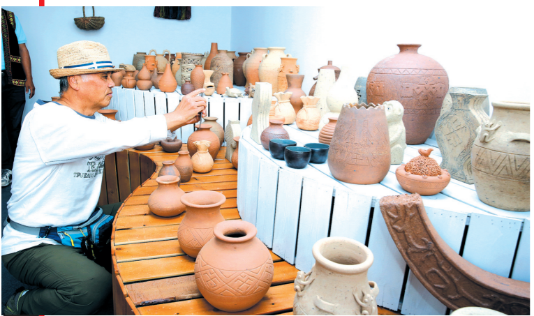
“海天盛筵”展区, 一名嘉宾在拍摄黎陶工艺品。