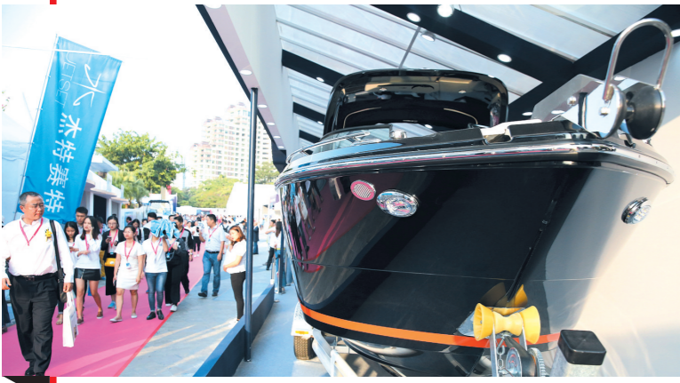
“海天盛筵”展区, 游艇展品参观者络绎不绝。

今年海天盛筵以“梦想启迪世界·悦享智慧人生”为主题, 展位面积达到6000平方米, 展览规模为近三年来最大的一届, 观展人数超过2.5