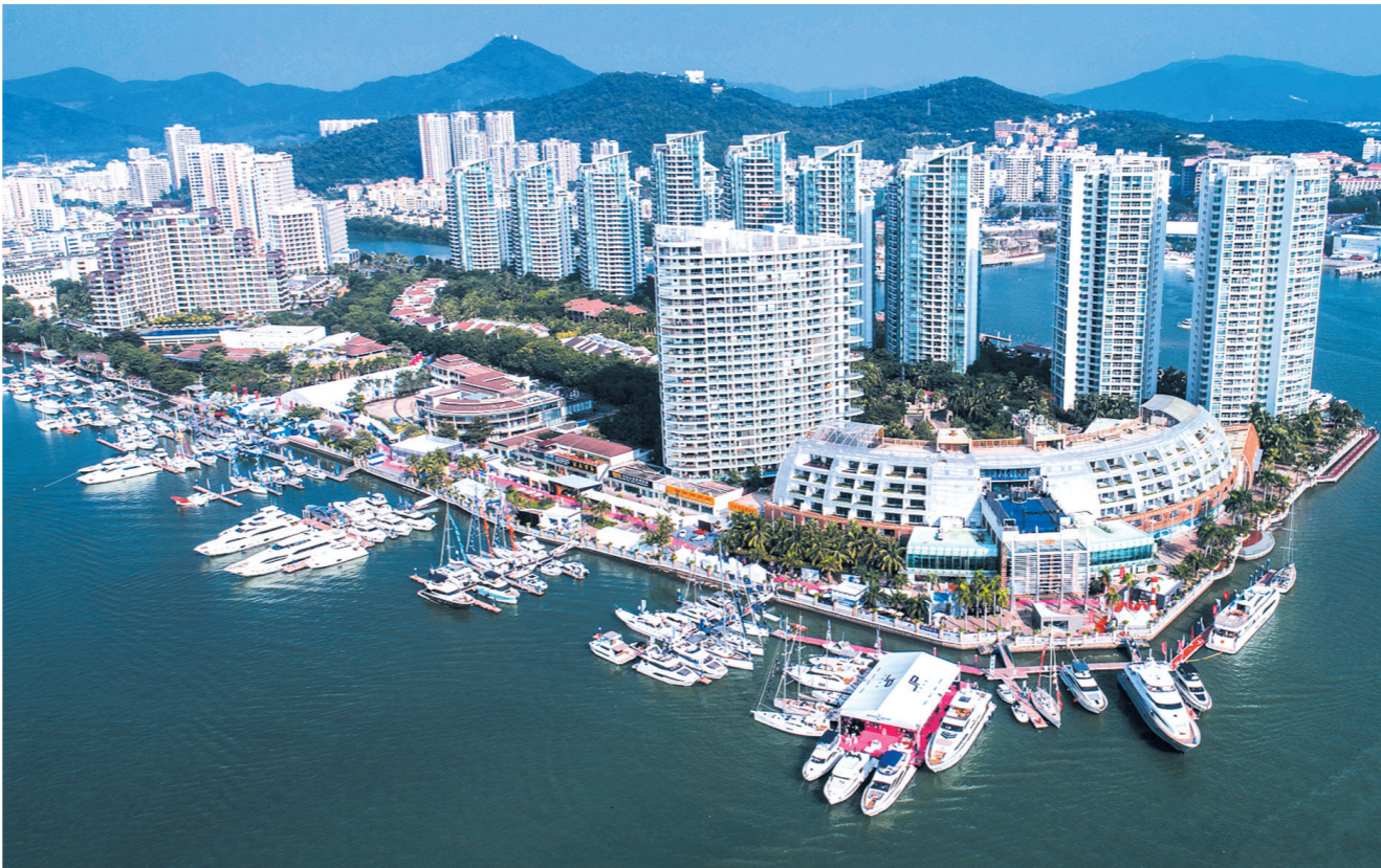
高空俯瞰鸿洲时代海岸码头, 碧波荡漾, 游艇云集。