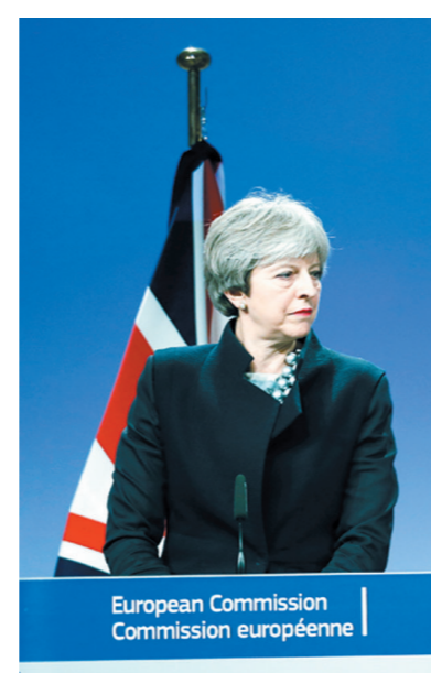
12月4日,在位于比利时布鲁塞尔的欧盟总部,英国首相特雷莎·梅(左)与欧盟委员会主席容克出席新闻发布会。

但特雷莎·梅和容克的谈判并不顺利,双方先是比原计划多谈了近50分钟,随后又临时安排了一场只有3分钟左右的新闻发布会。容克在发布会上称特雷莎·梅是“强硬的谈判对手”,双方在4日达成完整协议的计划落空了,“但这不是失败,只是最后扫尾阶段的开始”。他同时强调自己对在12月15日欧盟峰会前取得足够