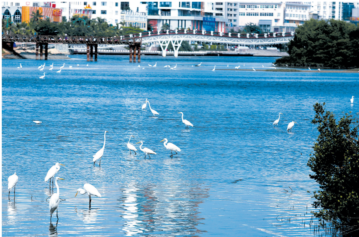
三亚河上白鹭欢。

2015年,三亚被列为全国首个“双修”试点城市。2016年,全国生态修复城市修补工作现场会在三亚召开,三亚“双修”成为全国经验。新一届市委、市政府提出打造“双修”升级版,在《三亚市建设世界级滨海旅游城市行动方案》(以下简称“十大行动”)中明确“双修”升级版行动,为走内涵式发展道路再探索,为城市治理提供样板。