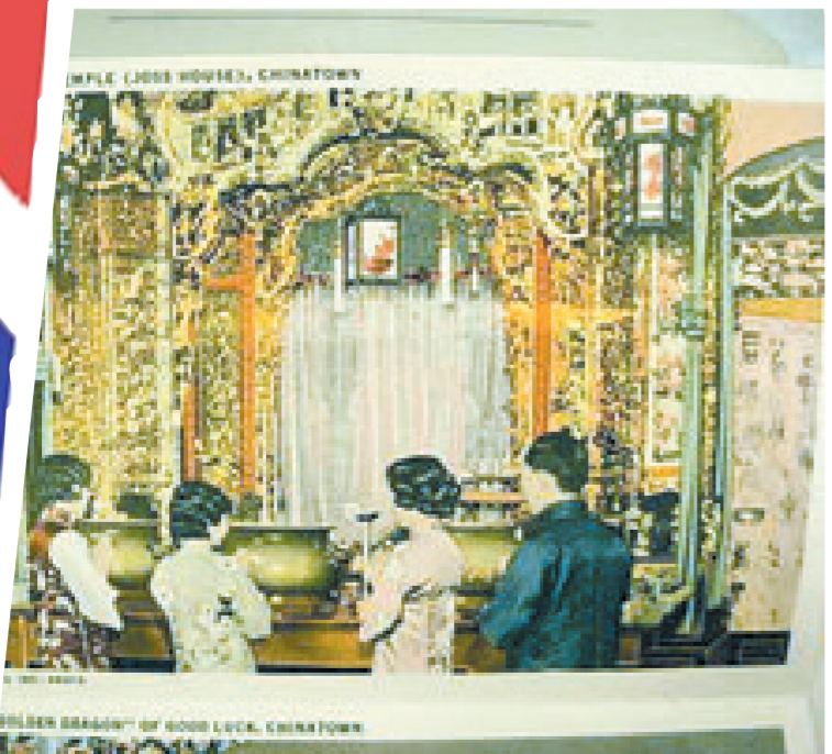
旧金山唐人街明信片

我爱收集老明信片,尤其是早期美国唐人街画面的。美国不像中国,诸多城市都有每日营业的邮品店,美国只有一年中举办几次的邮品集市对公众开放。而这些邮品集市总能淘到不少纸色泛黄、画面吸睛的唐人街老明信片。