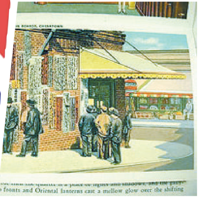
旧金山大地震前一天的唐人街景象