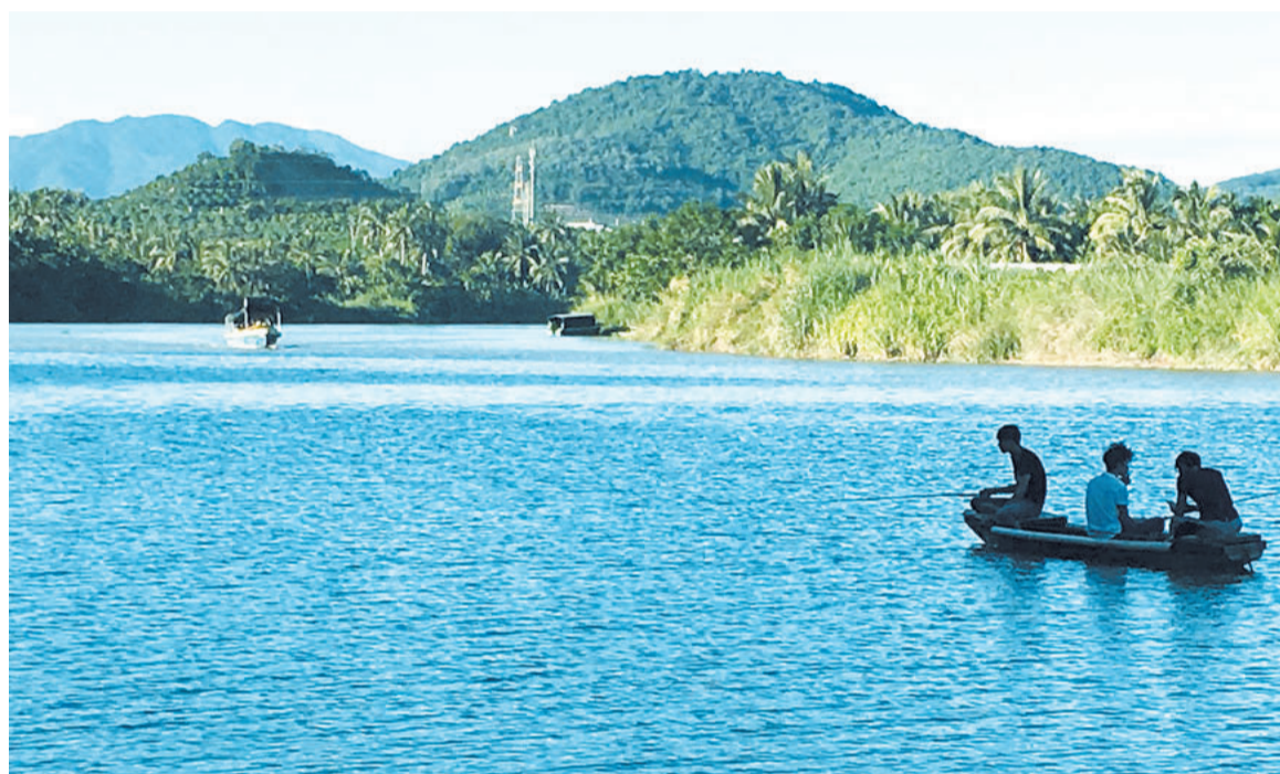
奔流入海的藤桥东河