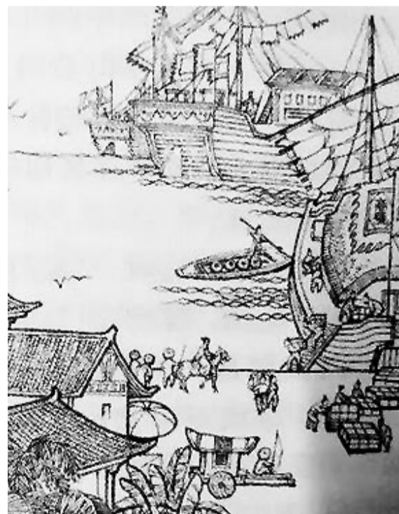
藤桥墟市曾经有过的繁华(翻拍)