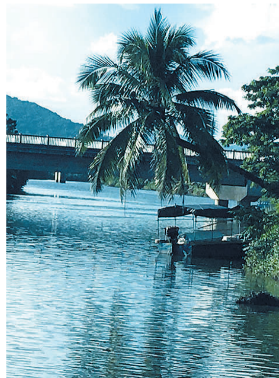
通桥而过的藤桥西河