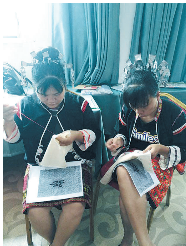
学员们认真学习“双面绣”

8月31日,在三亚市群众艺术馆二楼展厅,130余件精美的黎陶、色彩鲜艳的黎锦吸引着观众驻足观看,展出的每一幅作品都制作精巧,富有夸张和浪漫色彩,图案花纹精美,配色调和,鸟兽、花草、人物栩栩如生,博得参观者的一致好评。据悉,这些作品并非“非遗传承人”所作,而是出自“研修研习培训计划”的新学员之手。