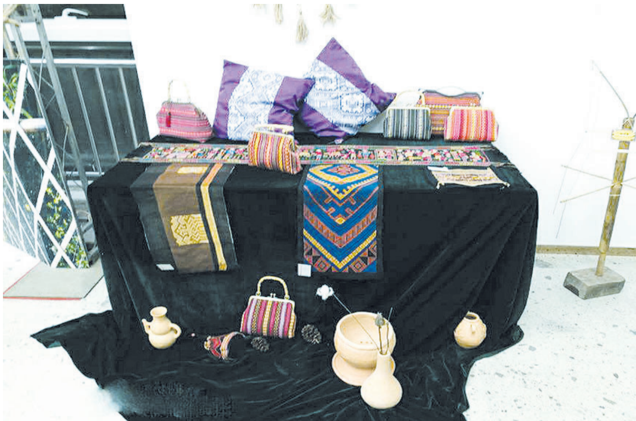
在三亚市群众艺术馆展出的色彩鲜艳的黎锦

化遗产传承人的教育活动,着眼于“强基础、增学养、拓眼界”,旨在通过组织非遗传承人的研修、研习、培训,帮助非遗传承人提高文化艺术素养、审美能力、创新能力,在秉承传统、不失其本的基础上,提高中国传统工艺的设计、制作水平,促进传统工艺走进现代生活,促进现代设计走进传统工艺,促进就业增收。该计划对于推动相关高校加强中华优秀传统文化教育、更好发挥文化传承创新功能、服务地方经济社会发展具有积极作用。