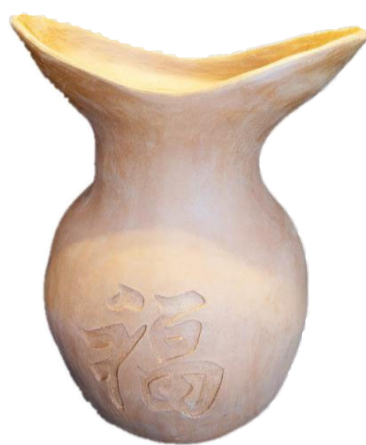
学员们制作的黎陶作品