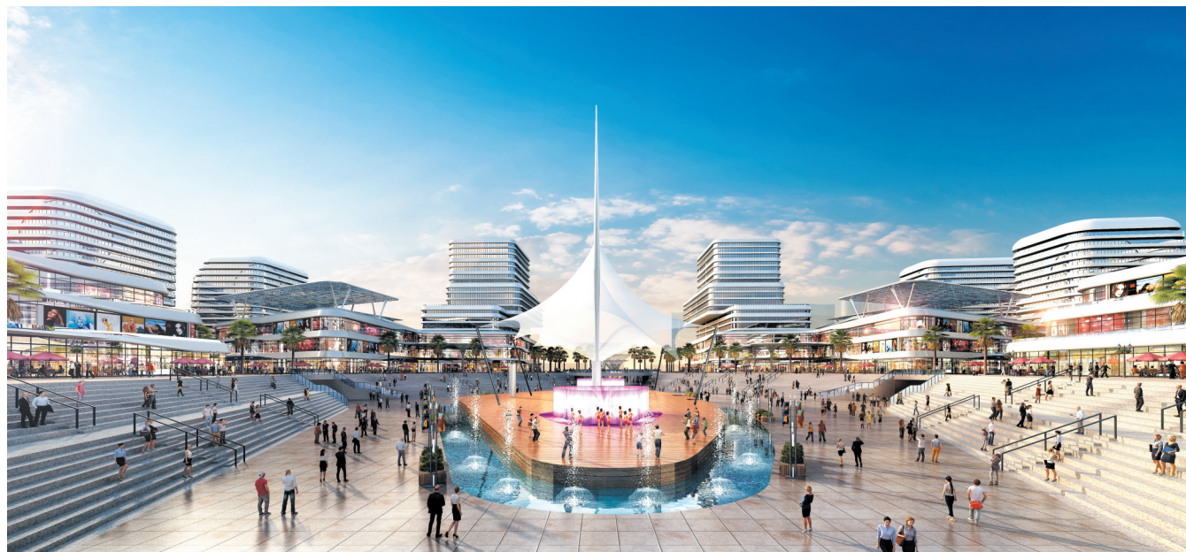
海坡碧桂园项目效果图。

元成功竞得三亚海坡村棚户区四宗地块,四宗地块将建设精品商业、商务、文化娱乐、精品酒店等高端服务配套,弥补三亚缺乏商贸中心的空白。