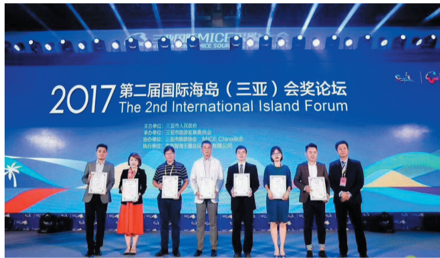
三亚市旅游委新聘7位业内专家担任三亚会奖旅游业顾问。

去年9月,三亚已成功举办了首届国际MICE采购大会暨国际海岛(三亚)会奖论坛。各路买家与本地酒店、会展企业签订了3.19亿元的会议团队订单,且在接下来的2016年10月至2017年3月期间,三亚各类会议活动同比增加近30%。8月25日下午15时30分闭市锣声响起之时,全场的买家意向成交金额刷新了往届的纪录,达到了4.286亿元,其中意向成交额超过800万元以上的企业达到16家,单个企业最高意向签约金额6500万元。 经过一年的发展和变化,三亚会