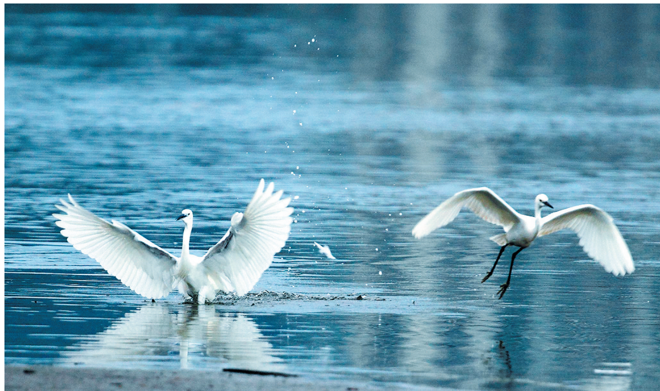
白鹭在三亚河翩翩起舞。

口整治;四是加强水环境治理,强化水环境质量目标管理,保障饮用水水源安全,加大黑臭水体治理力度,实现河湖环境整洁优美、水清岸绿;五是加强水生态修复,依法划定河湖管理范围,强化山水林田湖系统治理;六是加强执法监管,严厉打击涉河湖违法行为。