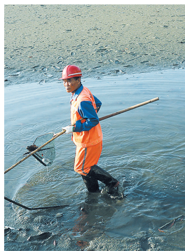
三亚河退潮后,数名水上环卫工人正在滩涂上清理垃圾。

除了日常的巡查,陈广谊还要将巡查工作形成详细的台账,发现重大问题立即上报。值得他庆幸的是,他发现的多处排污口事件得到市领导的重视,并召开现场办公会研究解决方案。“现在很少能发现排污事件和黑臭水体,看着河