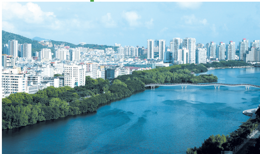
高空俯瞰三亚河,犹如一幅水清岸绿美景画,美不胜收。本报记者 袁永东 摄