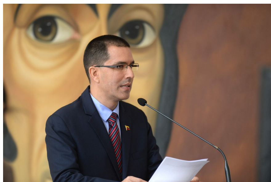
8月12日，在委内瑞拉首都加拉加斯，委内瑞拉外交部长阿雷亚萨在与全体驻委外交使团的会议上讲话。

墨西哥外交部发布公告说，墨西哥重申美洲17国外长会议声明内容，谴责委内瑞拉当局“破坏”民主秩序，不承认制宪大会合法性，同时反对使用武力解决委内瑞拉国内问题。墨西哥将使用一切可能的外交手段，通过和平协商方式，“修复”委内瑞拉民主。