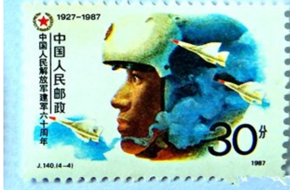
1987J.140《中国人民解放军建军六十周年》邮票