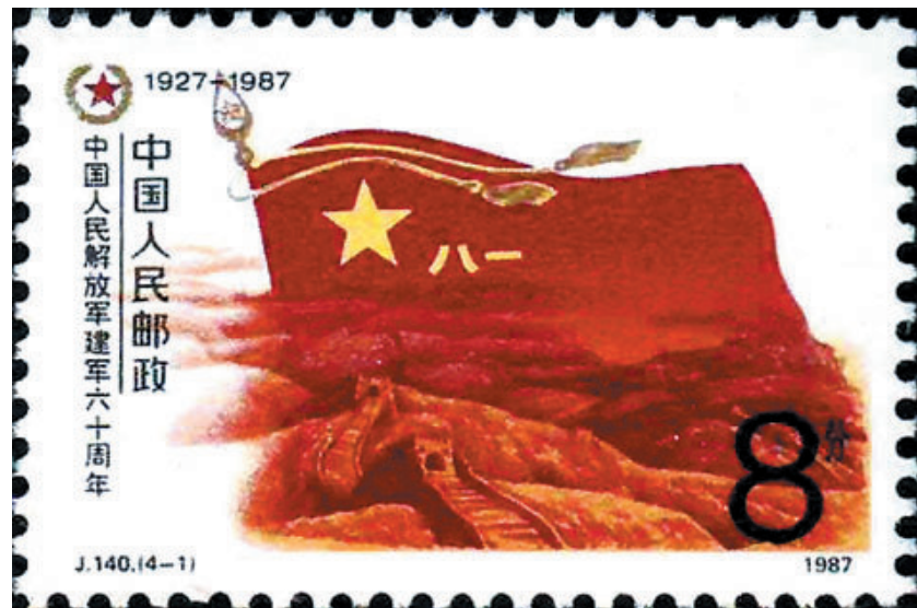
1987J.140(4-1)《中国人民解放军建军六十周年》邮票

1977年8月1日,正值建军50周年。为此发行的5枚纪念邮票——“加速我军革命化现代化建设”“井冈山军旗红”“游击健儿勇”“雄师过大江”和“钢铁长城”,充分反映我军的战斗历程。这套邮票使用彩色影写版印刷,邮票图案带有鲜明的宣传画特征,激情磅礴,展现了人民军队半个世纪的征程,传达出放眼未来的建军理念。