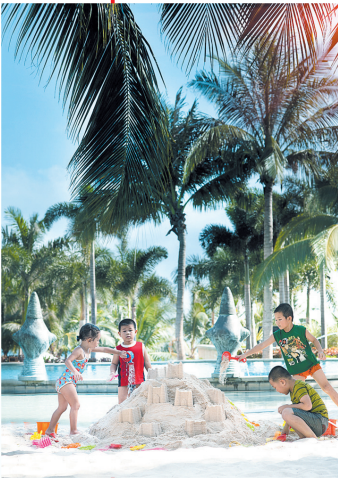
三亚文华东方酒店的儿童活动室