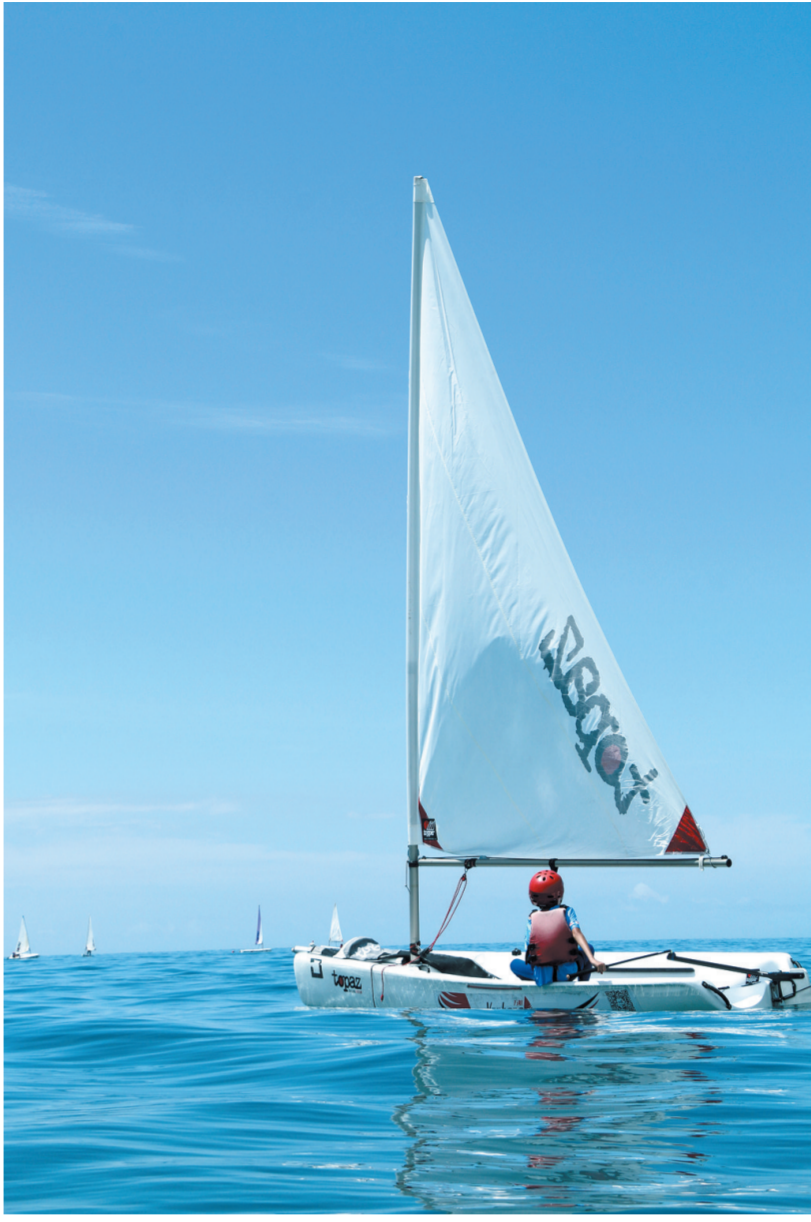
帆船也是孩子们的最爱。