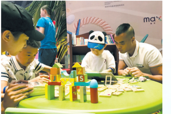
孩子们参加酒店举办的夏令营。

性价比也是吸引旅游者来到三亚的一大因素。据此前媒体报道,暑期三亚游价格不升反降,上海等地去三亚的机票往返最低只需1300元左右,几百元可以预订热门五星级酒店。 携程旅游统计表明,今年推出的三亚度假产品卖价相比去年下降8%左右,很多高端酒店价格并不高。以5天4晚自由行(5钻)为例,选择三亚湾喜来登等5钻度假酒店,全国主要城市出发,只需要每人2000元起,包含往返机票、接送机、4晚酒店费用及早餐,还提供“买贵退差价”的价格保障,相比单订更便宜。 有记者查询发现,海外海岛暑期的价格都有明显上涨,东南亚海岛游的价格最低在三四千元起,冲绳在六七千元的水平。三亚相比海外一些热门海岛要明显便宜。