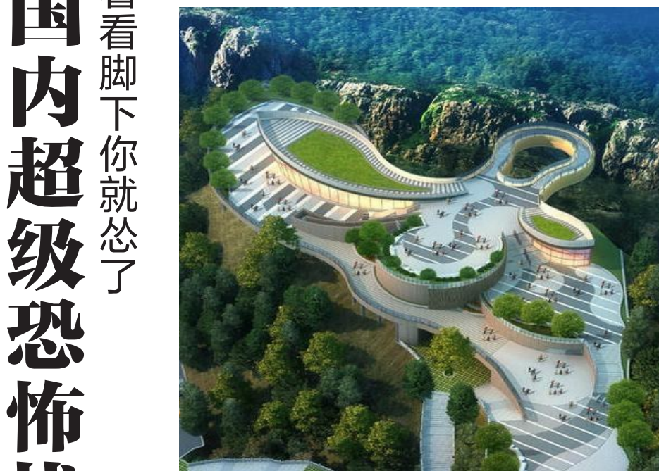
重庆云阳龙缸玻璃廊桥