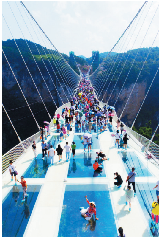
张家界大峡谷玻璃桥

悬崖栈道或是观看千尺奇峰,悬崖绝壁或是体验深谷涧壑,万丈深渊,险要处仅可容身。现在,不仅有先人留下的古栈道,还拥有许多方便游客欣赏风景的玻璃栈道。旅游过程中,有人喜欢追求刺激,所以那些超级恐怖的栈道就成为了大家的首选。那么,今天就为大家盘点国内最值得挑战的栈道,看看你敢去吗!