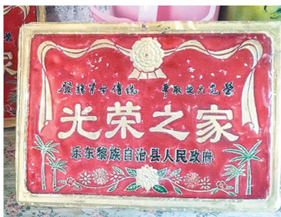
在血和火的斗争中获得的荣誉

87年来,中共莺歌海党支部紧紧依靠和团结勇敢、勤劳、智慧的莺歌海人民,在激荡的海风里,炽热的阳光下,红旗始终高高飘扬,一代又一代优秀共产党员带领渔家儿女,演绎了一个又一个保家卫国、建设美好家园的感人至深、可歌可泣的故事。在这片神奇而光荣的土地上,不断增添新的荣耀!