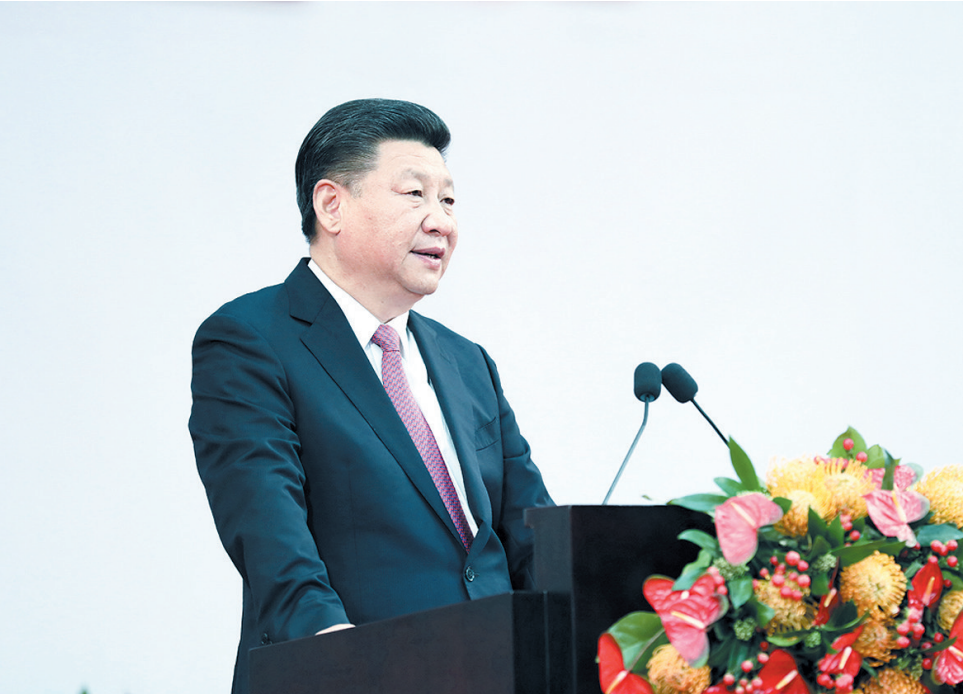
上图:7月1日上午,庆祝香港回归祖国20周年大会暨香港特别行政区第五届政府就职典礼在香港会展中心隆重举行。中共中央总书记、国家主席、中央军委主席习近平出席并发表重要讲话。