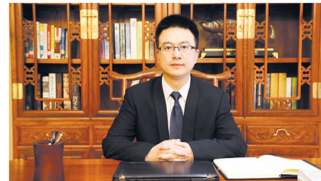
天地家总裁向海南业主 郑重承诺

方的营业展厅, 有8种风格样板间展示和上百种建材品牌选择, 业主只要将主材、辅材、家具、配饰、家电在营业展厅内逐一选定, 价格清晰透明, 一站式完成风格确定和材料选择, 让你再也不用跑建材家居市场, 不用费心讨价还价, 不用担心装修质量和效果, 真正省心省力、省时省钱。