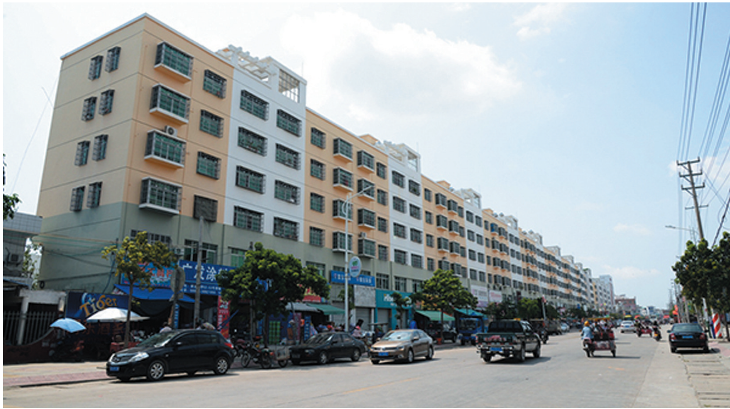
乐东黄流镇整洁干净的街道。

“下了高速公路,只要看见路边有一堆堆垃圾、小贩随意占道经营、车辆大排长龙,说明你已进入乐东境内。”这是乐东人曾经无奈的自嘲。此前,乐东城乡环境“脏、乱、差”一直备受诟病,尤其是当地人有嚼槟榔的习惯,在路面上、墙壁上、花草上、树干上,都有槟榔水的身影,当地百姓也见怪不怪。但这两年,乐东环境卫生状况大大好转,甚至成为学习典型。据了解,2013年以来,乐东打响城乡环境卫生整治攻坚战,全县上下推进市容村貌等整治工作。县城各街道分段分片,划出责任区,由115个县直机关单位包干,进行全天候保洁管理,并督促沿街店铺落实“门前三包”。喊破嗓子不如甩开膀子、做出样子。乐东四套班子成员每人驻点一个乡镇,全程负责整治工作。县委书记林北川驻点九所镇,顶着烈日扫大街、洗槟榔水,一扫就是一个星期。治理随地乱吐槟榔水顽疾,乐东重于言传身教。干部在劝说教育的同时,主动清理冲洗路面、墙壁、围栏上的槟榔水。群众吐,马上清洗;群众再吐,再清洗;群众还吐,继续清洗,不懈的努力感化一位位群众自觉停止随地乱吐行为。80多岁的邢阿婆嚼了几十年槟榔,每次上街前都会在口袋里装个塑料袋,“在家嚼槟榔有垃圾桶,在外面就吐在塑料袋里。”现在,每每看到有年轻