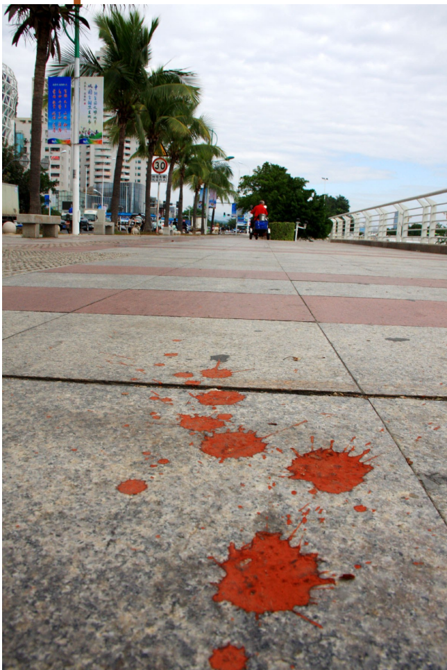
12月23日,河西路人行道上仍有人乱吐槟榔水。