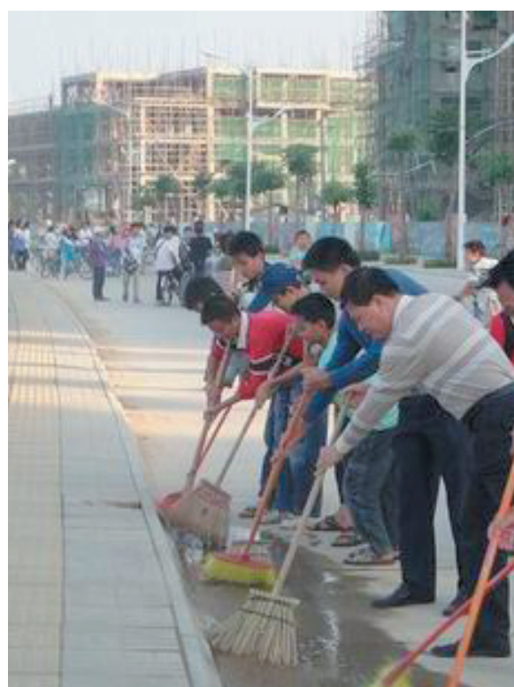
机关干部上街打扫卫生(资料图片)。

人随地乱吐槟榔水,她都会主动上前制止,批评他们不讲卫生。此外,乐东抓好宣传教育,让环卫观念深入人心。卖槟榔的小摊贩会自觉备上垃圾袋,卖槟榔时一并“送上”,不让槟榔水随地乱“跑”。加大经费投入,提升城乡环卫功能;推进乱搭乱建、乱堆乱放、乱设摊点、乱拉乱挂、乱贴乱写乱画、乱扔乱吐“六乱”集中整治;完善长效机制,推动环境卫生管理常态化,先后出台了《城乡容貌和环境卫生管理办法》、《环境卫生长效管理意见》、《县城重点路段和地点卫生管理制度》、《农村环境卫生整治标准》等相关制度措施。同时,将环境卫生综合整治列为各镇、各部门年终考核五项内容之一,实行一票否决制,建立每月考评制度。县委对各责任部门进行履职监督;成立由人大代表、政协委员、县委督查室、县委组织部、县政府督察岗和县电视台组成的督察组,不定定期对各乡镇进行巡查考评,巡视情况进行月度评分排名。考评结果处于末位的乡镇,乡镇主要领导和驻点县领导在电视上向全县人民检讨。就是在这样多管齐下、多措并举的行动下,乐东谱写了“乡风文明 村容整洁”的社会主义新农村建设新篇章。2013年,乐东被评为省级卫生城市,荣获全省环境卫生整治特别进步奖;2014年,环境卫生整治工作全省综合排名第一。