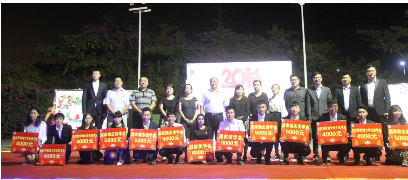
获奖学生代表与教师合影留念。

最后,颁奖典礼在各院系的表演展示中走向高潮。同学们可以通过互动游戏搜集到足够的印章,到欢乐节现场的7个分会场进行游览,集满印章的教师和学生还可以领取纪念品。(王晓盟)