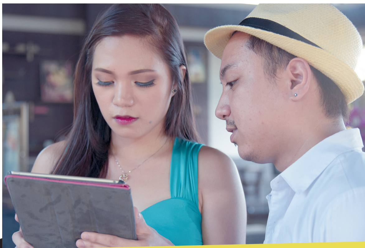
夫妻俩在进行节目彩排

在三亚的星级酒店里,我们总能在不同的地点听到那撩人的歌声,经过长途奔波的客人在大堂先静静地听上一首舒缓的歌曲,能让您的疲劳瞬间有所缓解。如今的三亚星级酒店越来越多,慕名而来的外国驻唱歌手也络绎不绝,他们当中大多来自菲律宾,为了追求更加稳定幸福的生活,也因为很喜欢中国喜欢三亚而远离祖国来到这里工作和生活。给大家印象,菲律宾人似乎天生就有一副好嗓子,更是翻唱高手,台上热烈的表现力与充沛的激情更是他们的特性。菲律宾为啥这么出歌手呢?可能是源于菲律宾全民对于卡拉OK的狂热,有着歌唱的土壤。即使是在贫民窟,哪怕在大街上,只要有一个麦克风,菲律宾人就能唱嗨起来。那么在三亚他们又是怎样一种生活状态?本期让我们一同走进他们在他乡的音乐生活。