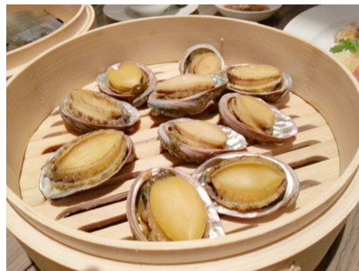
清蒸鲍鱼是美食菜谱——九笼蒸鲜的主要食材之一。

本报讯(记者 李正蓬)近日,三亚太阳湾柏悦酒店新任行政总厨林久淳先生携手其美食团队推出秋季美食新品——九笼蒸鲜。其厨师团队秉承私人府邸的理念和度假村的格调,为客人营造独一无二的食鲜体验。