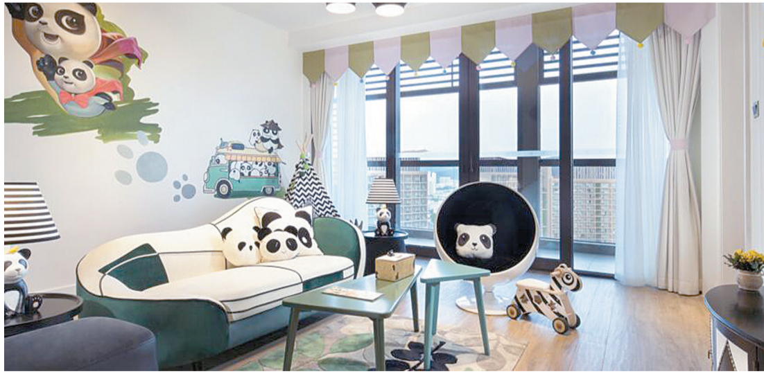
三亚棕榈王国亲子主题酒店的内部布置再现童话般的奇幻世界。

本报讯(记者 胡拥军 李正蓬)日前,第十三届“中国酒店金枕头奖”颁奖典礼在上海举行。三亚棕榈王国亲子主题酒店携手三亚亚龙湾瑞吉度假酒店分别获得亲子酒店金枕头奖和2016年度最佳服务酒店奖。