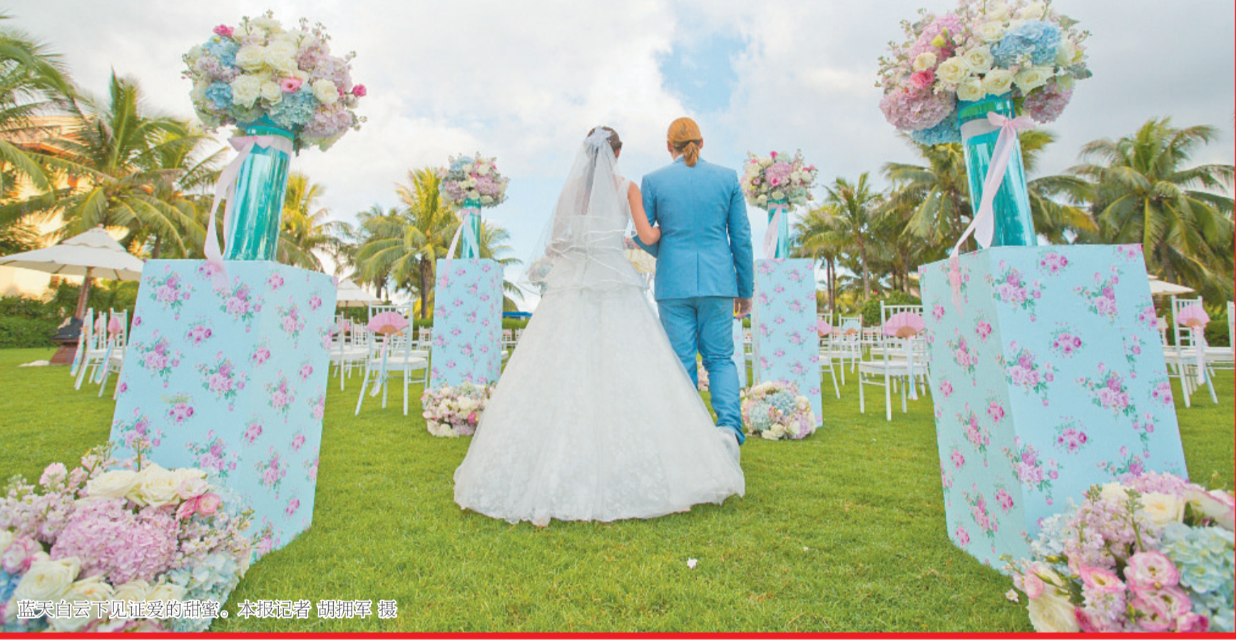
蓝天白云下见证爱的甜蜜。

瑞德姆源自法文“我爱你”的中文音译,内设的12座VIP包厢——汐菲娜也由法文“美人鱼”演绎而来。搭配幽蓝的色调,唯美的音乐,数只美人鱼自由穿梭在水底彩色珊瑚中,演绎国际一流的专业水中芭蕾,带领游客进行海底古炮沉船的神秘探险,瑞德姆营造的是真正海底体验和浪漫。