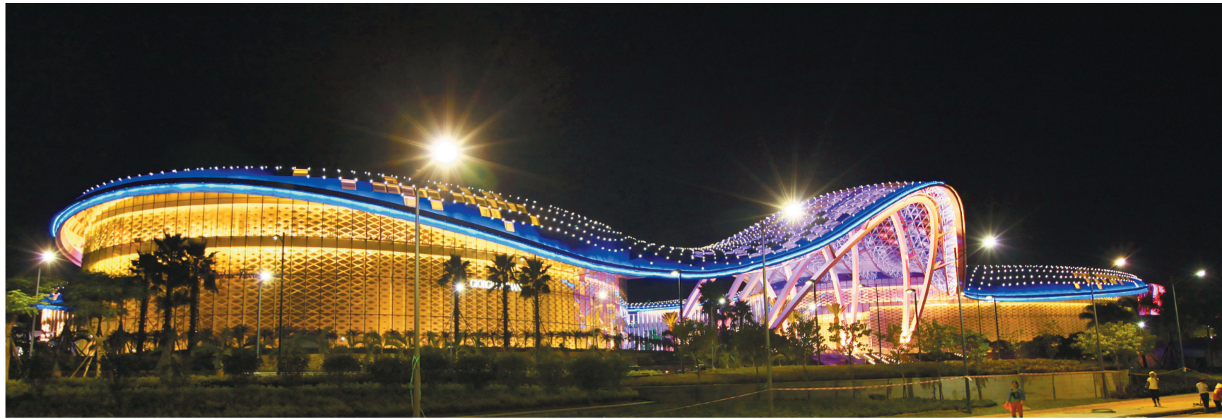
色彩缤纷的灯饰把三亚免税店装扮得妖娆多姿。(资料图片)

每当夜幕降临,三亚就成为火树银花不夜城。一盏盏街灯流光溢彩,一块块霓虹色彩斑斓,为三亚之夜增色添彩。在三亚看夜景,各种灯光交相辉映,折射于潺潺河水之中。当你伫立于这样梦幻般的夜景中,不经意间,也许会突然坠入迷离,仿佛置身于远离现实的梦境之中,如梦如幻!近来,随着“双修”建设的稳步推进,三亚城市夜景更加流光溢彩、神采飞扬。白天,三亚就像英俊潇洒的小伙,敞开着宽广的胸襟,以火热的情怀接纳八方来客;夜晚,三亚如同典雅的女子,披戴着五彩的霓裳,以轻盈的舞蹈欢迎四海贵宾。本期就让我们一同寻觅藏在浓浓夜色中的靓丽风景,感受华灯初上的魅力三亚——