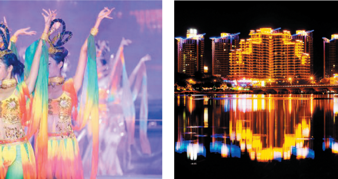
海上丝绸之路大剧场的舞蹈表演多姿多彩。(资料图片)