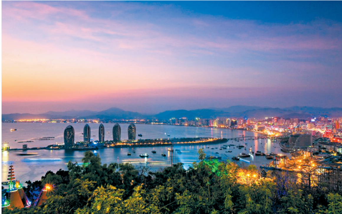
从鹿回头山顶公园可鸟瞰三亚梦幻般的夜景。