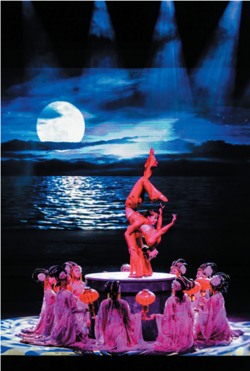
《三亚千古情》的剧照(资料图片)