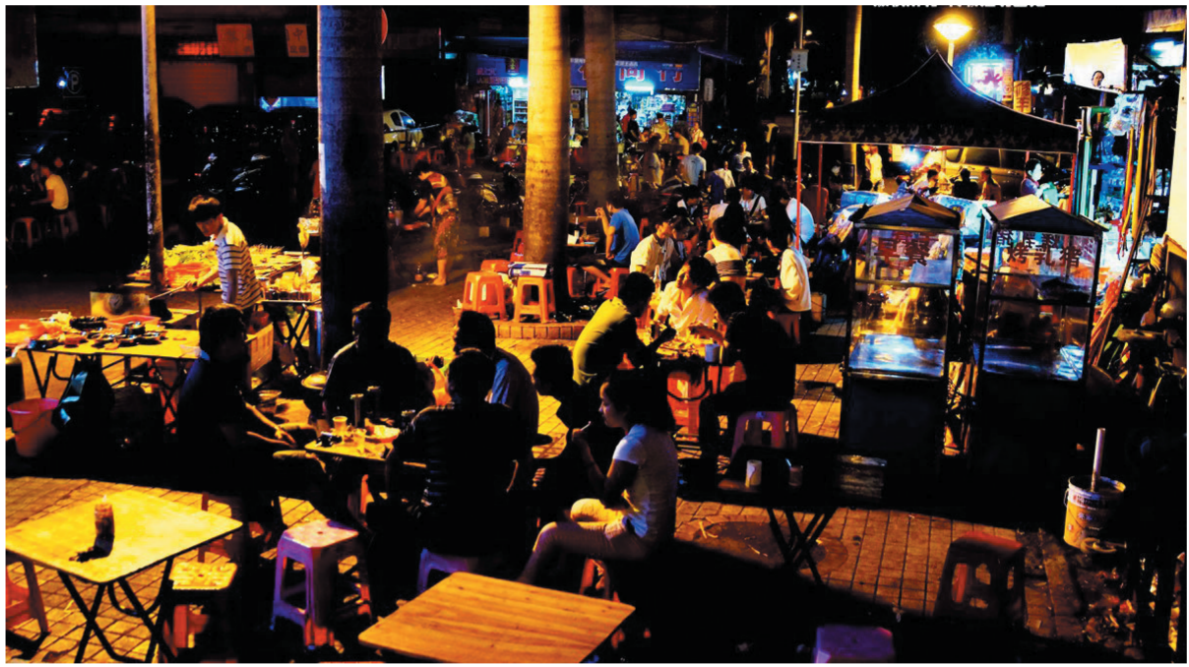
夜幕下的三亚美食广场