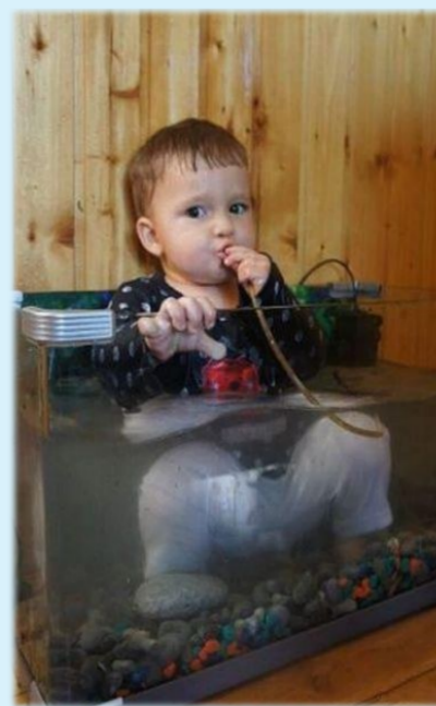
宝宝估计是太渴了吧,才会出此下策,话说,这鱼缸水味道如何?