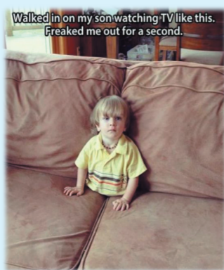
我就在这不出去,谁也阻止不了我看电视。

家有孩子是一件幸福的事情,但如果是家有“熊孩子”呢,那恐怕是一件十分恐怖的事情了。(环球)