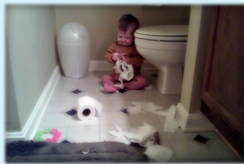
我藏在这里慢慢撕,老爸肯定不知道。