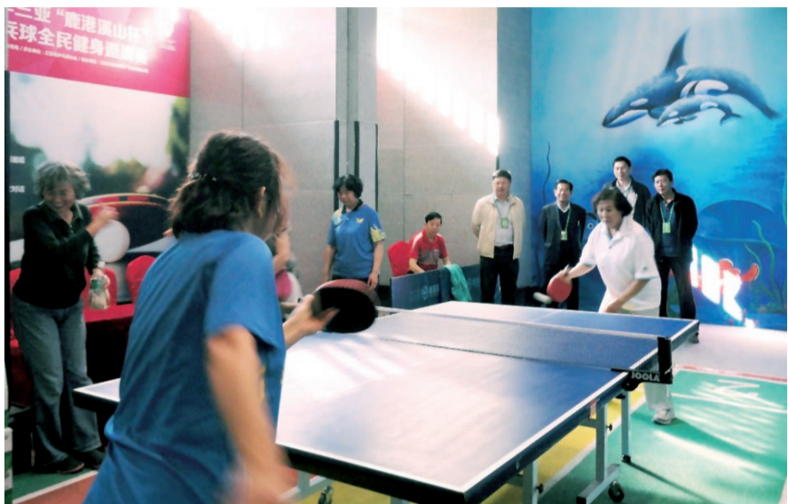
1月17日,参赛选手进行赛前训练。

诸多信息表明,“注意力”经济,逐渐渗透到文化体育赛事。仅鹿港溪山广场就给众多的三亚文化体育赛事提供场地,例如“加菲猫”空降吸引了全岛关注;三亚的羽毛球赛,调动了全市的积极性;广场舞的民间高手同台PK,给三亚注入了时尚元素。经过多年的市场培育,三亚文化体育赛事已形成方兴未艾之势,蓬勃发展,成为三亚靓丽的名片,助力三亚公共文化服务体系建设和转型升级。