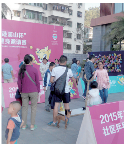
1月17日,市民踊跃参加在广场外举行的全民健身活动。